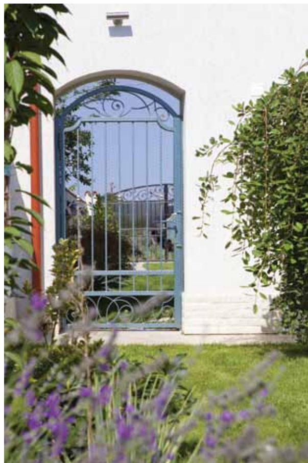
▲ COLOANELE , arcadele și formele rotunjite sunt elementele ce amintesc de stilul mediteranean, potrivit perfect unei case situate la doi pași de plajă.